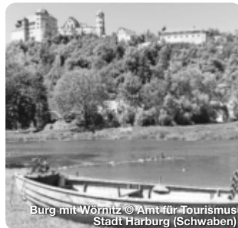
Burg mit Würnitz