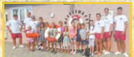
Rette sich, wer's kann lautete das Motto der Wasserwacht