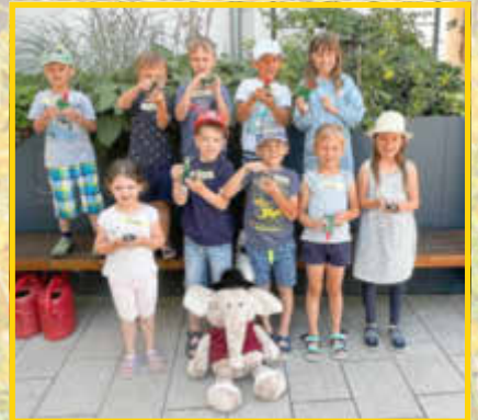
Willkommen in der Musikerwelt bei der Stadtkapelle