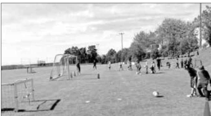
Fußball und Mehr gab es beim FC Weilheim-Rehau