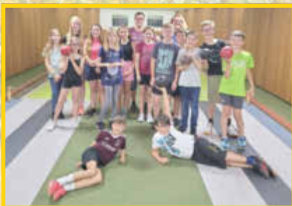
Mit Kolping gings zum Kegeln