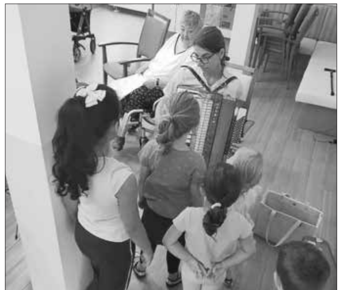
(Text und Fotos: Brigitte Gerhardt)

Aufgrund des großen Erfolges wird bereits die Ferienbetreuung im kommenden Jahr geplant.