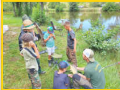
Einen Schnuppertag bot der Fischereiverein an