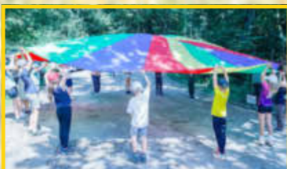
Der Bund Naturschutz lud ein zum Nachmittag in der Natur