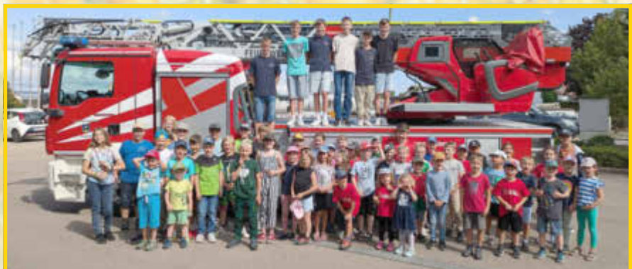
Rund um die Feuerwehr lautete das Motto der FF Monheim