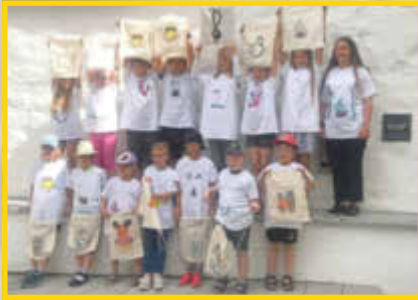
T-Shirts bemalen mit dem Gartenbauverein

Ein herzliches Dankeschön an die zahlreichen Vereine, Verbände und Organisationen, die durch Ihr Engagement und Ihre Unterstützung das Ferienprogramm 2024 der Stadt Monheim möglich machten. Hier ein paar Eindrücke zum Ferienprogramm 2024: Wir sind überzeugt, den Kindern hat das Angebot großen Spaß gemacht und wir hoffen, dass im nächsten Jahr wieder zahlreiche Veranstalter mit dabei sind. Den Kindern einen guten Schulstart und bis zum nächsten Jahr.