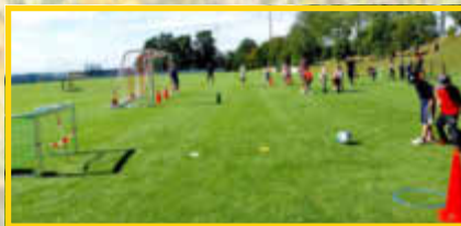
Fußball und Mehr gab es beim FC Weilheim-Rehau