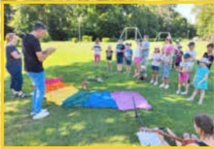
Kinderbibeltag von der evang. und kath. Kirchengemeinde