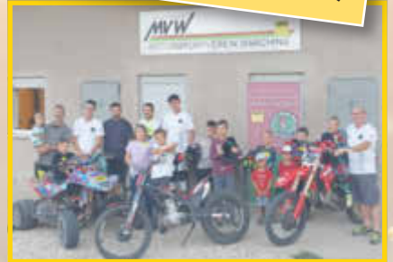
Moto Cross Schnupperstunde beim MV Warching