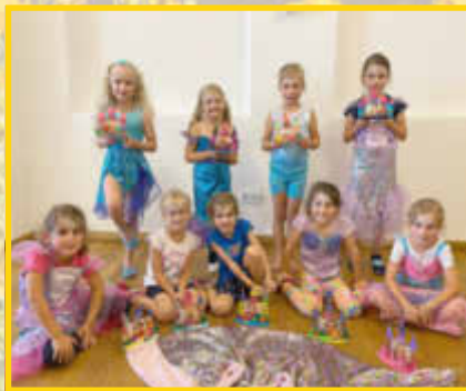
Unter dem Meer - Tanz, Spiel und Spaß von der FG Gailachia