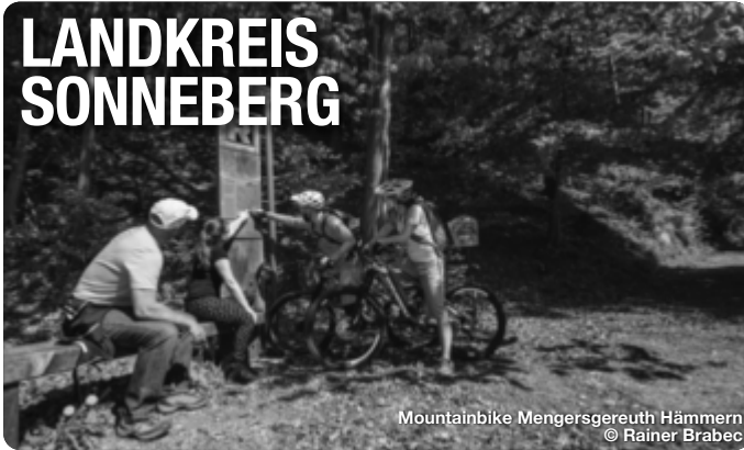
Mountainbike Mengersgereuth Hämmern

Alle Termine und Angaben unter Vorbehalt!