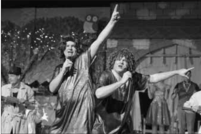
Die Weather Girls alias Jungelfer live in der Stadthalle