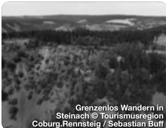
Grenzenlos Wandern in Steinach

LANDKREIS SONNEBERG Der Landkreis Sonneberg, gelegen im Herzen des malerischen Thüringer Waldes, ist eine wahre Schatzkammer für Naturfreunde, Handwerkbegeisterte und Erholungssuchende gleichermaßen. Die Spielzeugstadt Sonneberg, weltbekannt für ihre lange Tradition in der Spielzeugherstellung, begeistert Besucher mit ihrem Deutschen Spielzeugmuseum, dem Deutschen Teddybärenmuseum und einer Vielzahl von Attraktionen rund um das Thema Spielzeug. Das historische und bis heute ansässige Glashandwerk ist eher im Norden des Landkreises in und um Lauscha zu finden. Dort wurde übrigens auch die Gläserne Christbaumkugel erfunden! Bis heute werden viele wunderschöne Unikate aus Glas in vielen kleinen Manufakturen und Hütten gefertigt. TreffpunktDeutschland.de/sonneberg-region