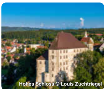
Hohes Schloss