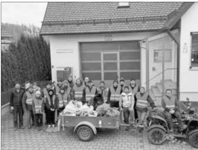
Die Itzinger Truppe nach geleisteter Arbeit