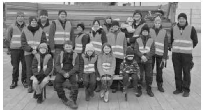
Gruppenfoto nach erfolgreicher Müllsammelaktion

(Text und Bild: S. Roßmann, Schriftführer)