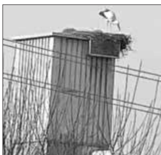
Das Pärchen im Nest am Oberen Torturm

Bereits am 07.02.25 wurde der erste Storch am Torturm gesichtet. Kurz darauf kam seine Liebe aus den letzten Jahren. Zu erkennen am Ring auf dem linken Fuß. Doch anscheinend hat sich der männliche Storch nicht um die Frau bemüht, sodass sie sich einen anderen Partner gesucht hat. Vier Wochen war er nun alleine, bis eine Neue Liebe plötzlich im Nest war. Jetzt kann bald das Eierlegen beginnen.